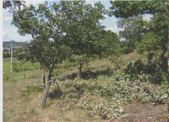
Rénovation d'une truffière à Ratières